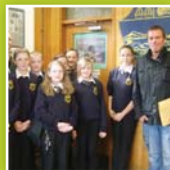
Ymgynghori a gwaith ar y gweill 2011