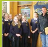
Ymgynghori a gwaith ar y gweill 2011